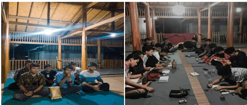
Gambar 3. Sekolah Adat di Bale Sangkep

Pada malam Rabu Tanggal 25 dan malam Sabtu Tanggal 28 Juli tahun 2023. Semua mahasiswa KKP UIN Mataram di Desa Barabali mengikuti kegiatan sekolah adat yang diadakan di Bale Sangkep Dusun Kelanjuh Lauq, Desa Barabali. Ada beberapa macam kegiatan yang diajarkan mulai dari bahasa sanskerta (Hanacaraka), tembang sasak, dan proses adat merariq.