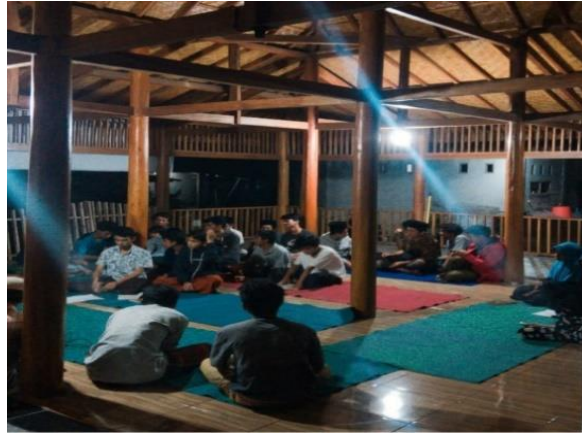
Gambar 2. Bale Sangkep Dusun Kelanjuh Lauq

Keberadaan Bale Sangkep ini memudahkan pelestarian adat istiadat yang ada di Desa Barabali, khususnya Dusun Kelanjuh Lauq. Karakteristik Dusun Kelanjuh Lauq yang didominasi keturunan bangsaan menjadikan kehidupan masyarakatnya kental dengan tradisi leluhur. Sehingga pada tahun 2000 sampai tahun 2007 diadakanlah sekolah adat. Kegiatan ini diadakan melalui rumah kerumah oleh Lalu Dirajat dan sempat facum selama 11 tahun. Hal ini karena tidak adanya penerus atau guru yang melanjutkan. Pada tahun 2020 salah satu warga dari Dusun Kelanjuh Lauq menikah menggunakan adat istiadat sasak (sorong serah aji krame. Hal ini membuat para remaja bertanya mengenai makna-makna dari rangkaian proses pernikahan (merariq) tersebut. Sehingga pada tahun 2020 juga Bale Sangkep digunakan sebagai tempat belajar adat istiadat sasak dimulai dari belajar Bahasa sanskerta, tembang, dan adat merariq.