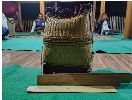
Gambar 1. Tulisan Sankserta dan Tas Gandek

Desa Barabali merupakan salah satu desa yang terletak di Kecamatan Batukliang Lombok Tengah. Desa ini terdiri dari 23 dusun dan memiliki populasi 13.362 jiwa dengan mata pencaharian dominan sebagai petani (25,34%). Umumnya ekonomi masyarakat Lombok, Desa Barabali bertumpu pada sektor pertanian yang tanah garapannya berbentuk sawah yang dilengkapi dengan sistem irigasi teknis dan sebagian besar menanam padi dan sayur-sayuran. Sebagai masyarakat agraris, kehidupan masyarakat Sasak masih tetap mempertahankan nilai-nilai tradisional atau traditional indigenous seperti kekerabatan dan kegotongroyongan dalam mengerjakan sawah maupun upacara adat dan tradisinya. Desa barabali juga merupakan desa yang sangat kental dengan adat istiadatnya. Sebagian dari wilayah desa barabali masih menggunakan tradisi dan upacara adatnya seperti yang ada di Dusun Kelanjuh Lauq. Dusun tersebut masih menyimpan benda-benda bersejarah peninggalan dari nenek moyangnya tetap dilestarikan sampai saat ini, seperti tulisan-tulisan sanskerta dan tas gandek.