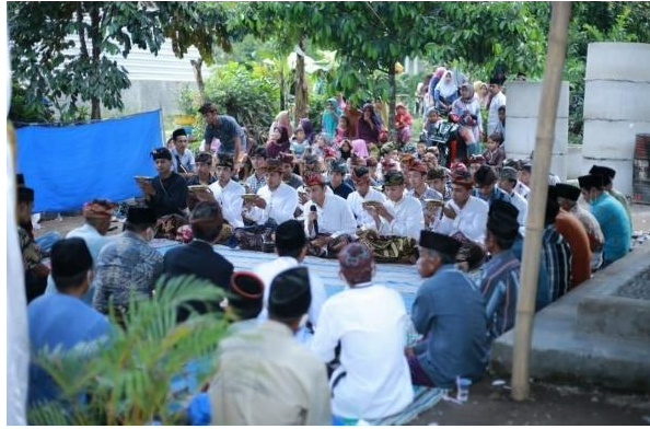
Gambar 5. Pembacaan Tembang pada Upacara Adat

Adat merariq merupakan sistem perkawinan yang unik di mana laki-laki harus kawin lari atau menculik perempuan sebelum mereka melakukan pernikahan ritual. Merariq biasa terjadi di kalangan masyarakat Sasak di Lombok yang mayoritasnya agama islam. Dari merariq ini timbul tujuh macam penyelesaian yang pertama, sejati (pemberitahuan), selabar (penentuan mahar), bait wali atau nikahan (mengambil wali dari pihak perempuan), bait janji (penentuan tanggal pernikahan), sorong serah (membayar aji krama), nyongkolan (persandingan pengantin), dan balas telapak naen (kembali kerumah pengantin).