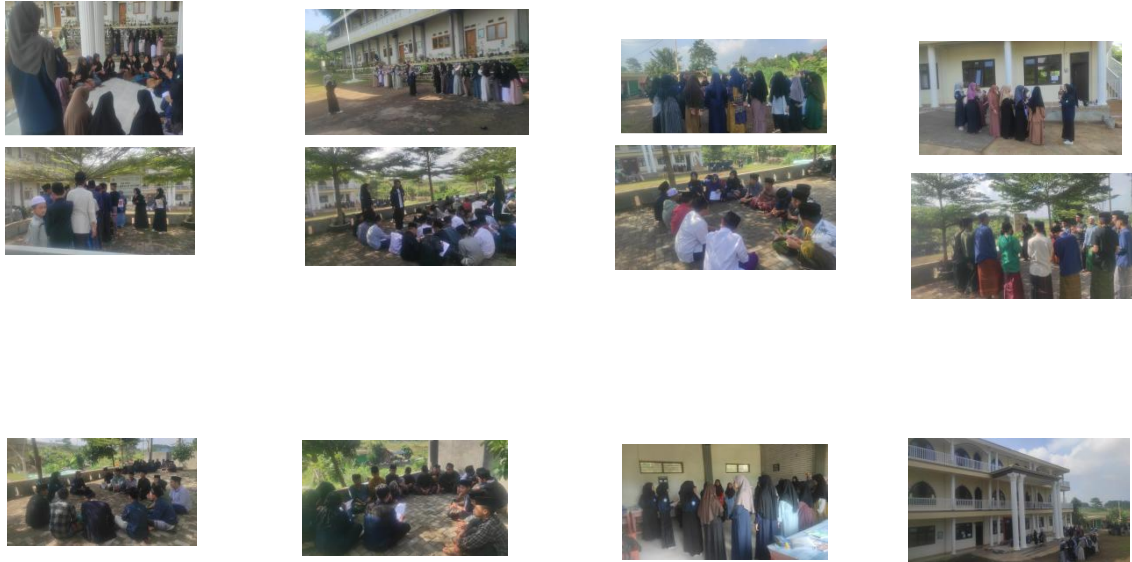
Gambar: sampel kegiatan santri