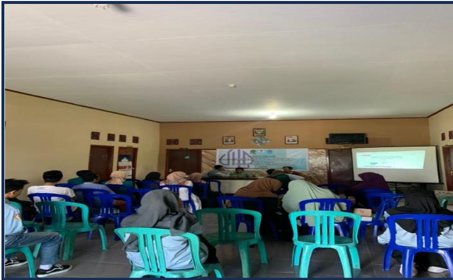
Gambar 2. Pelaksanaan Sosialisasi Sertifikasi Halal

Setelah dilakukannya pendampingan dari pihak Lembaga Halal Center, berakhirilah acara sosialisasi tersebut. Selanjutnya untuk para peserta yang belum melengkapi persyaratan saat proses pendampingan sosialisasi berlangsung, kami mendatangi rumah masing-masing peserta untuk dimintai data-data mengenai persyaratan penerbitan sertifikat halal. Diantaranya kami mendapatkan foto KTP, foto KTP penyelia (penanggung jawab), daftar bahan, daftar proses pembuatan, NIB, NIK pemilik dan penyelia. Setelah mendapatkan data-data yang diperlukan, kami menyerahkan data-data tersebut ke pihak Lembaga Halal Center.