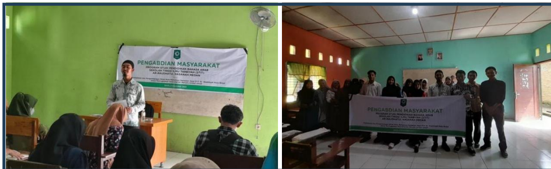
Gambar 2. Berdiskusi dan berkolaborasi dalam merancang kerangka tulisan