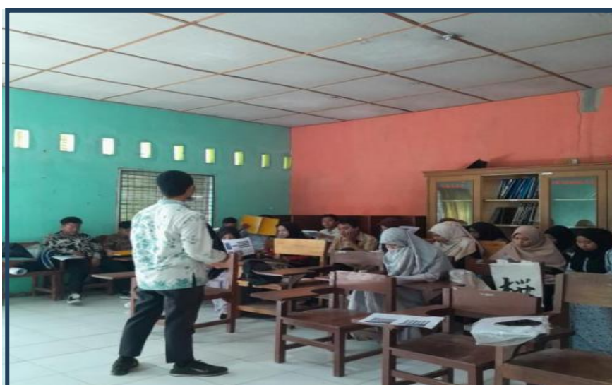
Gambar 3. Sesi mentoring penerepan kepenulisan

Berlandaskan data yang dianalisis, adanya perbaikan hasil nilai tes terhadap pemahaman mahasiswa terkait penulisan ilmiah dari 30% menjadi 65% berdasarkan hasil pretest dan posttest. Dalam hal kompetensi mahasiswa, produk penulisan yang dibuat memperlihatkan pertumbuhan kualitas pada konsep yang jelas, tidak monoton, dan keterhubungan.. Observasi kelas mengungkap peningkatan penggunaan platform digital, dengan 90% mahasiswa memperlihatkan kompetensi yang baik pada penggunaannya. Dengan demikian memberikan indikasi adanya adaptasi yang baik dari cara belajar modern juga penting pada era digital.