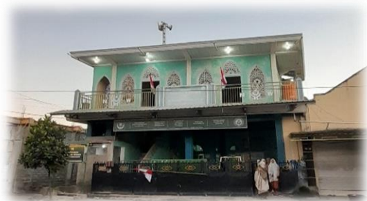
Gambar 01. Bagunan TPQ Masyiatullah

Qur'an. TPQ Masyiatullah NW pada awalnya merupakan majlis ta'lim yang bernaung dibawah Lembaga Dakwah, yang pada saat itu masih berlokasi di berugak dan seiring berjalannya waktu TPQ ini menjadi Yayasan Masyiatullah NW (YAMSYI) yang pada saat ini juga terdapat TK/RA yang kegiatannya berlangsung di pagi hari. Sedangkan TPQ-nya berlangsung di sore hari dan dilanjutkan pada waktu magrib sampai jam 09:30 ( ba'da isya ), dan memiliki Gedung khusus dalam proses mengajar berlangsung.