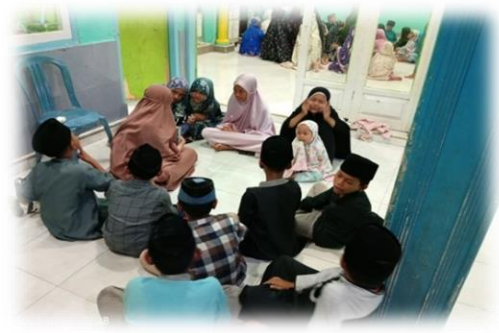
Dokumentasi ngaji berkelompok

Berdasarkan dari tasmi' yang dilakukan oleh Tim KKP-PAR STAI Darul Kamal NW IT terhadap santri yang pada tingkatan mushafy masih sangat minim mereka mempraktikkan cara membaca Al-Qur'an yang sesuai dengan kaidah tajwid. Dari 26 orang yang ikut dalam program ini terdapat 85% dari mereka belum bisa mempraktikkan cara mengucapkan huruf yang sesuai dengan makhorijul hurufnya , dan tajwidnya. 24