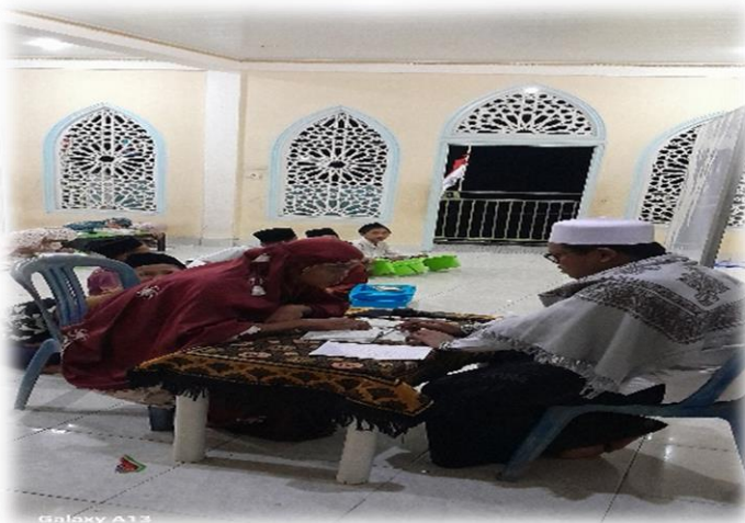
Gambar: 02 praktik membaca Panjang ( mad )