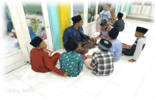
Dokumentasi ngaji berkelompok