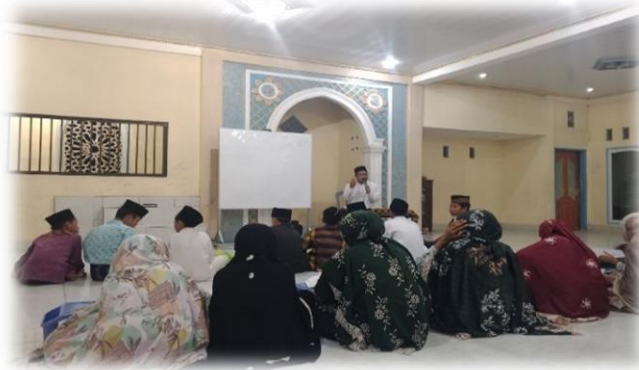
Gambar: 02 pengenalan dengan materi iqro' 1 dan diiringi dengan praktik

memperkenalkan nama huruf ( ismul harfy ), suara/bunyi huruf ( shoutul harfy ), dan tempat keluar huruf ( makhorijul huruf ). Pada jilid ini bertujuan untuk melatih dan membimbing santri-santri untuk membaca huruf sesuai dengan makhrojnya dan mampu membedakan cara baca setiap huruf yang sering dibaca dengan bacaan yang sama, dalam hal ini huruf yang sering dibaca sama oleh para santri diantaranya adalah huruf ش dibaca ,س, huruf ح dibaca ها dan lain sebagainya.