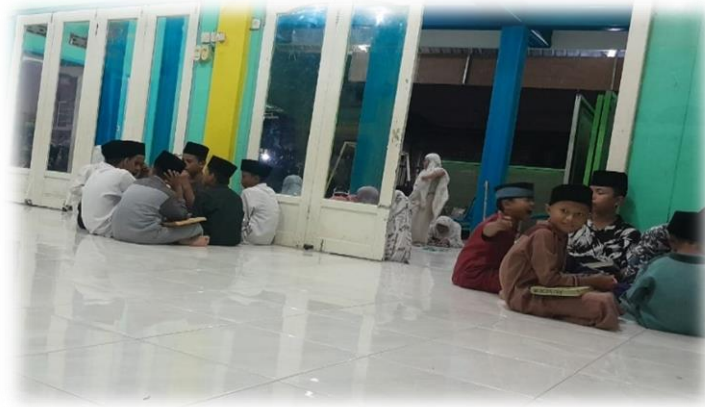
Gambar 04: Peraktik mengajar oleh Sebagian guru muda

Adapun tahapan selanjutnya adalah memberikan pelatihan husus dan peraktik mengajar kepada para santri yang nilainya diatas 80% untuk mengembangkan potensi mengajarnya. ketika guru muda terjun kelapangan hal yang paling di kedepankan adalah memperbaiki bacaan para santri yang masih keliru dalam mengucapkan huruf hijaiiah bagi santri yang masih pada tingkatan Iqro', sedangkan yang turun mengajar Al-Qur'an yang paling diperhatikan adalah makhorijul huruf dan pengaplikasian ilmu tajwid dalam membaca Al-Qur'an.