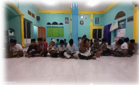
Dokumentasi aktivitas belajar mengajar

Santri yang ikut mengaji di TPQ Masyiatullah NW terdiri dari beberapa jenjang sekolah, yaitu mulai dari Sekolah Dasar (SDN), Madrasah Ibtida'iah (MI), SMP, SMA dan juga anak-anak yang masih TK/RA. Diantara mereka ada yang masih pada tingkatan ngaji iqra' (jilid) juz amma , dan Tingkat mushafy (Al-Qur'an). 20