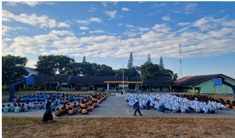
Gambar 4. Suasana Sosialisasi Sekolah Ramah Perempuan

Peserta Sosialisasi sangat antusias dalam mendengarkan materi yang disampaikan oleh pemateri.