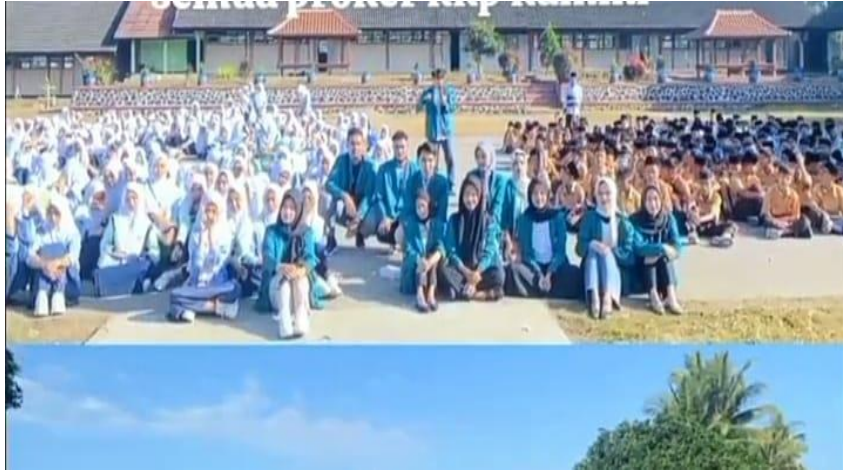
Gambar 5. Peserta Sosialisasi