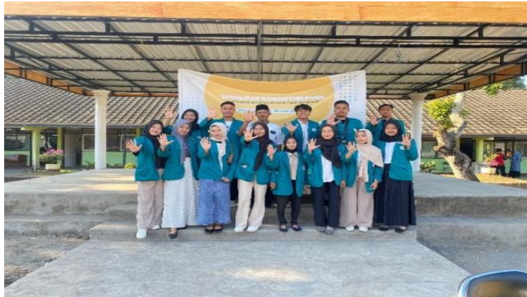
Gambar 6. Foto Bersama dengan Kepala Sekolah

Kegiatan Sosialisasi ini ditindaklanjuti dengan evaluasi.