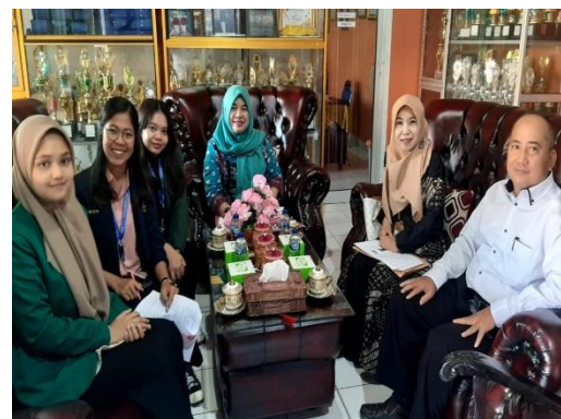
Gambar 5. Kegiatan Sharing Session

Selain itu, Forum Kegiatan Komunikasi dan Koordinasi Sekolah dan Post-Test sebagai wujud evaluasi atas kegiatan Program Kampus Mengajar Angkatan 3 di SMP Negeri 1 OKU berjalan