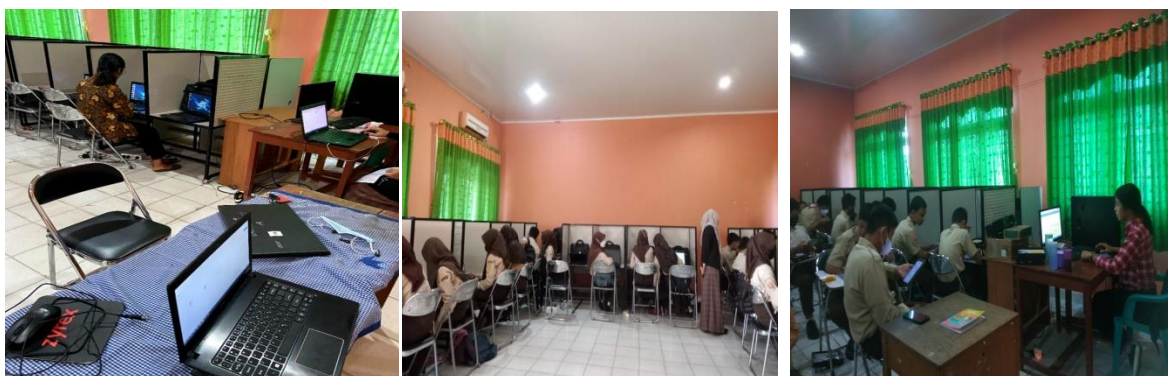
Gambar 3. Kegiatan Membantu Adaptasi Teknologi

Untuk pelaksanaan Pre-test serta Post test AKM berjalan dengan baik dan lancar meski terdapat kendala di awal pelaksanaan yaitu berupa tidak dapat dibukanya aplikasi AKM yang disebabkan oleh penuhnya jaringan. Namun, tim dapat mengatasi hambatan dengan cara mengubah “Mode Jaringan” menjadi “Mode Penyimpanan”. Untuk membantu guru dalam mengoperasikan aplikasi Zoom Meeting , AKM Kelas dan juga aplikasi Merdeka Belajar juga berjalan dengan lancar. Tim membantu guru yang ingin mempelajari aplikasi Merdeka Belajar dimana aplikasi tersebut memuat informasi serta pelatihan kurikulum baru yaitu Kurikulum Merdeka. Berikut lampiran kegiatan membantu adaptasi teknologi.