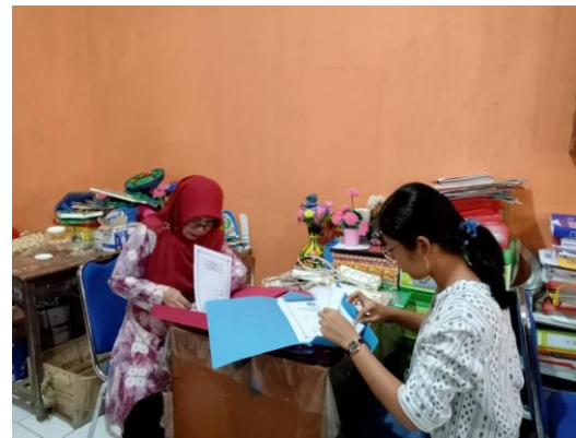
Gambar 4. Kegiatan Membantu Administrasi Sekolah dan Guru