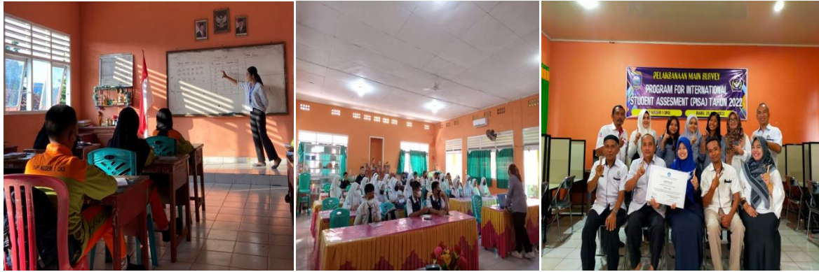
Gambar 2. Kegiatan Mengajar