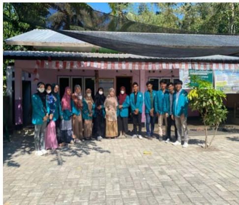
b. Keadaan fisik sekolah PAUD Raudatussibyan Al-Mannan