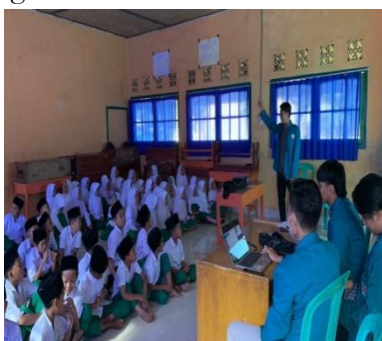
a. Kegiatan sosialisasi di MI NW 2 Kembang Kerang Daya

Pada sosialisasi ini ada proses intraksi diskusi terkait materi yang di sampaikan agar pengetahuan anak-anak lebih mendalam. Proses pelaksanaan sosialisasi dapat dilihat pada gambar 2.