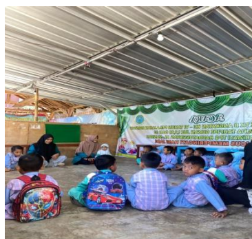
b. Kegiatan sosialisasi di PAUD Raudatussibyan Al-Mannan