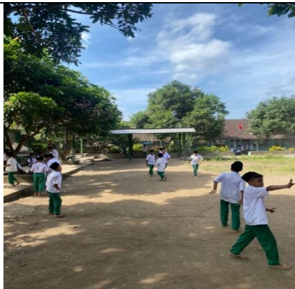
a. Keadaan fisik sekolah MI NW 2 Kembang Kerang Daya

sejak dini. Penerapan pendidikan nilai Islam pada pendidikan usia dini harus melibatkan seluruh elemen yang menunjang iklim sekolah, agar terjadi interaksi positif antara anak didik dengan nilai-nilai yang akan diinternalisasikan. Guru sebagai suri teladan ( role model ) dalam kegiatan belajar mengajar harus berkomunikasi dua arah dengan anak berdasarkan keikhlasannya. (Ahmad Junaedi, 2019). Kemudian masalah kedua yang di dapatkan di lapangan secara umum yaitu kurangnya penekanan dalam mengetahui peran dan pentingnya menanamkan nilai agama, padahal Penanaman nilai-nilai agama sejak usia dini merupakan krusial karena dapat membentuk perilaku maupun mental spiritual dan keagamaan anak di masa depannya. (Muhammad Ali Saputra, 2016). Hal ini nampak terlihat dari tingkah laku anak yang ada di sekolah.