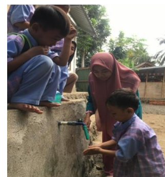
c. Praktik Wudhu di PAUD Raudatussibyan Al-Mannan